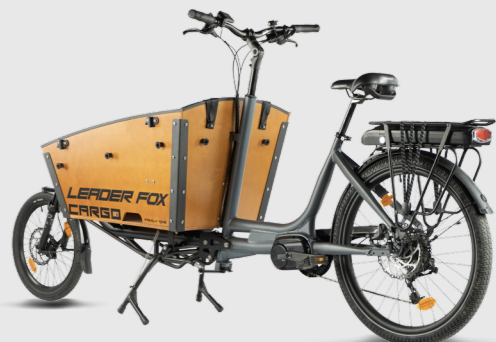
FAMILY ONE CARGO